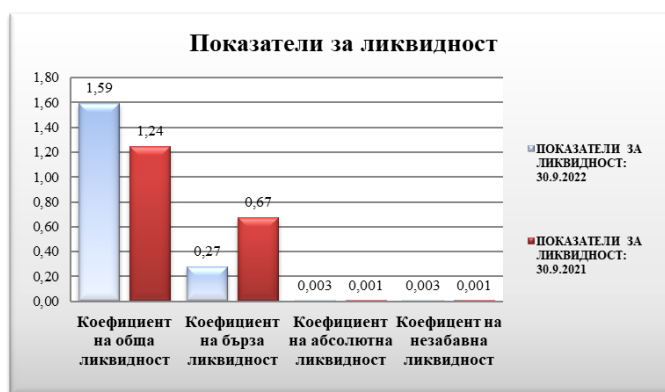
Таблица № 2